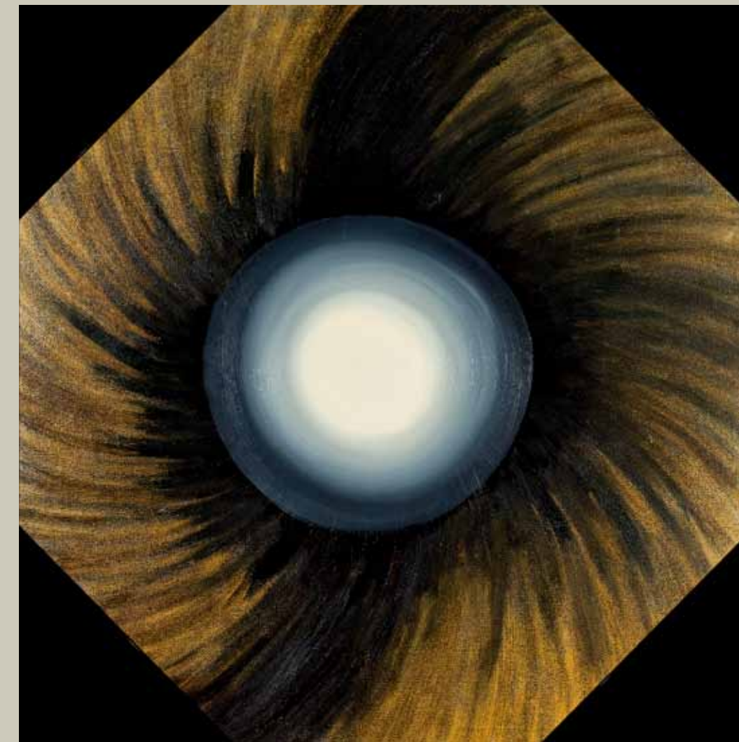
Mystery Of Time or Magician's Cabinet Canvas, oil. (Detail)