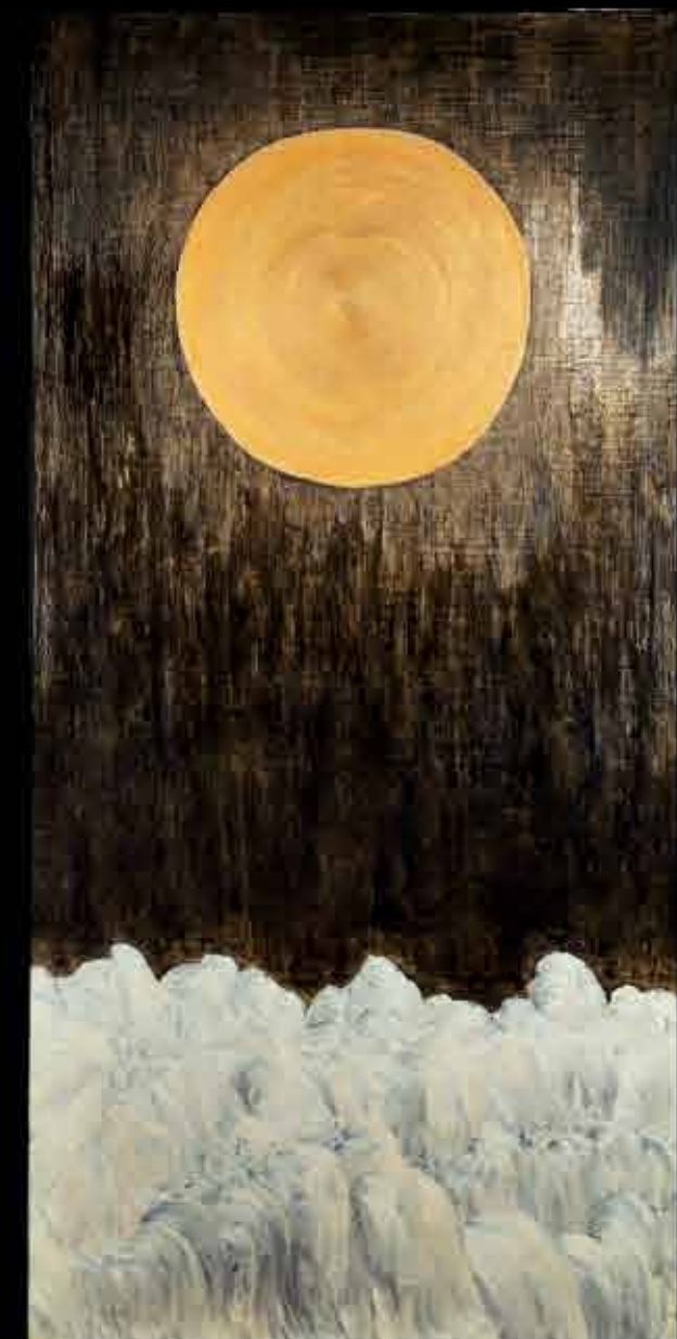
Mystery Of Time Or Magician's Cabinet 200x100 cm, 80x80 cm, 150x150 cm. Canvas, oil. 2005